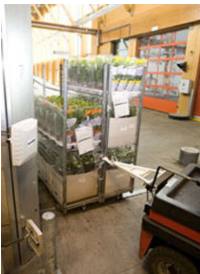
Een sensor herkent de CC-Items die met RFID-tag zijn uitgerust.

De proeven met Radio Frequency Identification (RFID) verlopen succesvol. Tijdens een eerste testdag herkende het systeem 97,7% van de beladen containers met een RFID-tag.